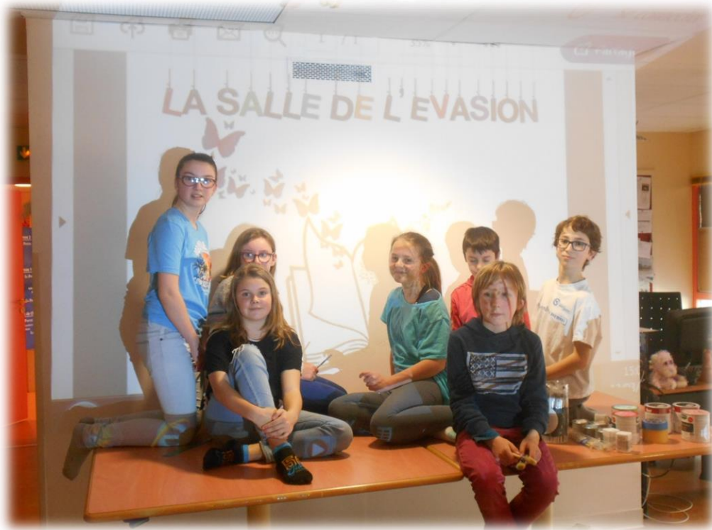
L'équipe du conseil municipal des jeunes de Quiberon