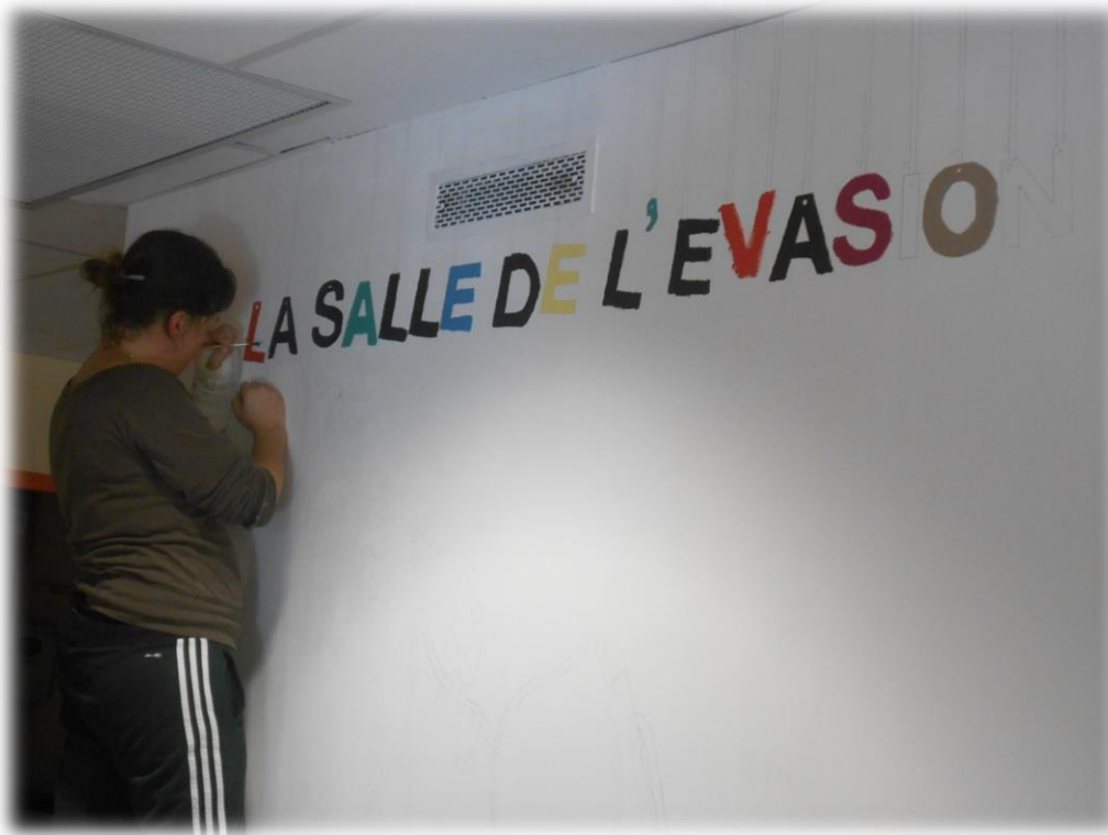
Voir article du Télégramme en fin de journal