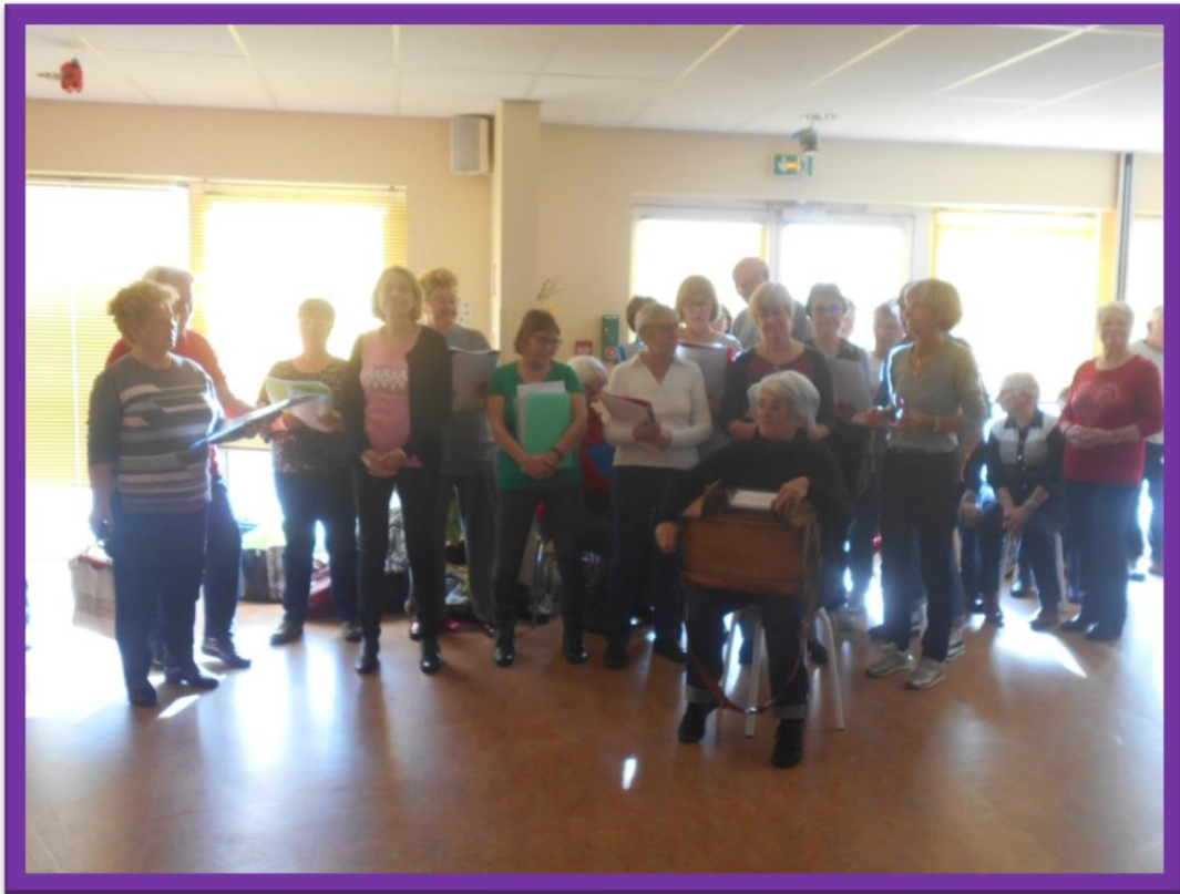
Groupes « La clé des chants » en haut et « La danse Bretonne » en bas