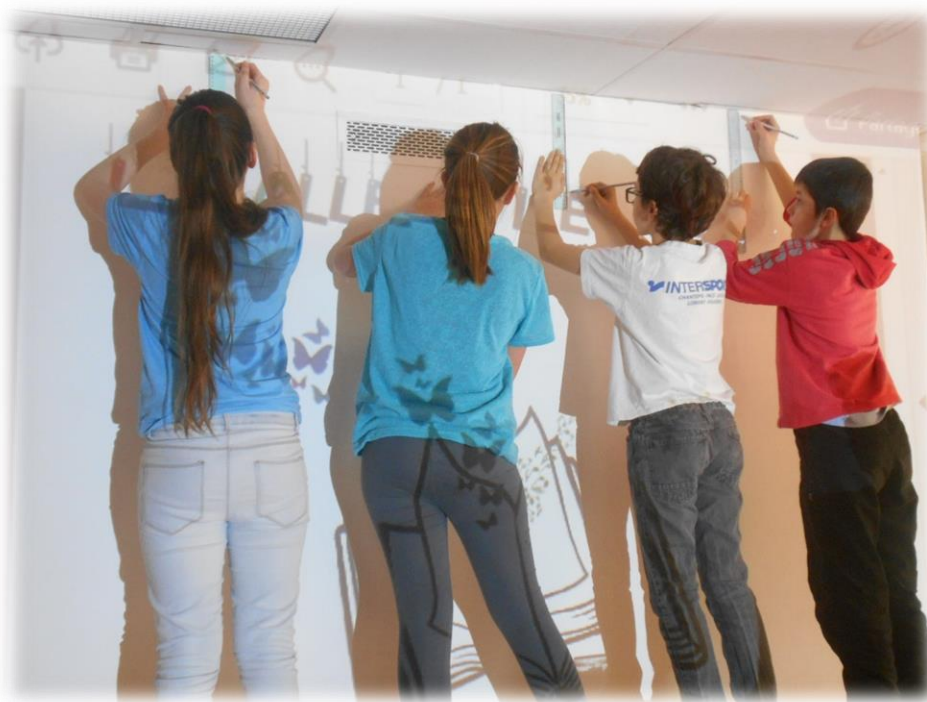
Démarrage du graff au crayon gris