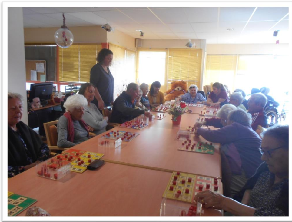
Au programme après-midi loto et goûter entre les résidents de l'EHPAD d'Etel et de Quiberon